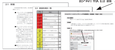
診断報告書サンプル