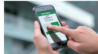
スマートフォン打刻

指静脈認証、パスワード認証、認証無しなど打刻時に弁当を自動注文するオプションもあります。