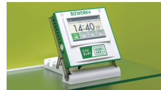
打刻専用タイムレコーダー