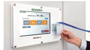
高機能タイムレコーダー