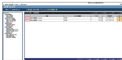
【ドキュメント管理画面】