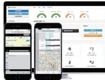
外出先でも使えるタイムレコーダー