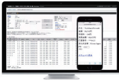
「給与即日払い」に対応