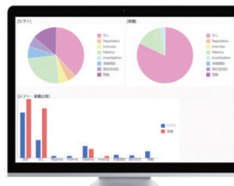
予実確認も一目瞭然