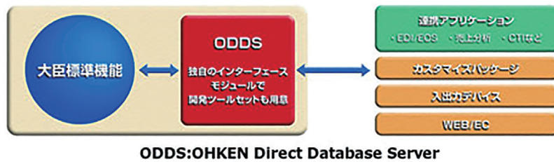
ODDS:OHKEN Direct Database Server